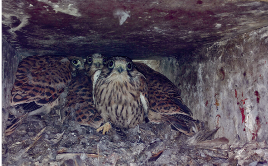
Tornfalkungar i holk år 2014. Det fanns rikligt med småfågelfjädrrar i holkarna. Den kanske mest intressanta ingrediensen i ungarnas skafferier var en husmus.