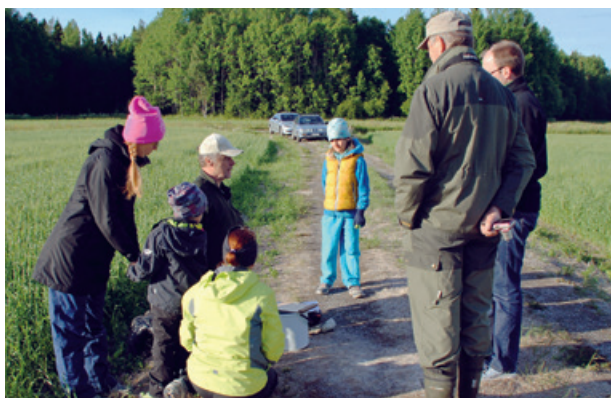
Tornfalkprojektet presenterades under en ringmärknings- ekskursion i Tölby- nejden den 24 juni.

Speciellt i de södra delarna av undersökningsområdet påträffades holkar där falkungarna hade åkersorkar i lager. Detta tyder på att åkersorken börjat föröka sig och därmed minskade häckningsframgången under häckningsperioden inte så drastiskt. Under år då sorkförekomsten minskar under häckningsperioden kan denna s.k. kalendereffekt vara synnerligen märkbar. Ifall snöförhållandena är bättre 2014–2015 kan sorkförekomsten och därmed förekomsten av tornfalk öka sommaren 2015!