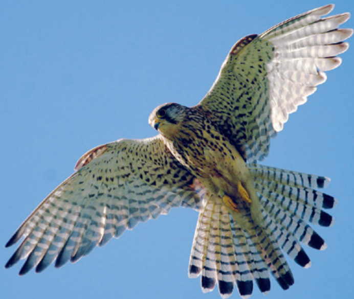
Ryttlande hona.