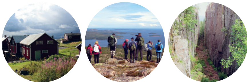
Från vänster till höger: Marviksgrunnan. Utsikt från Slåttdalsberget; Slåttdalsskrevan.

På kvällen förenades vi med resten av gruppen, som hade med sig en del av Södra Ulvön till oss, d.v.s. grå diabas och röd rapakivgranit (Nordingrågranit).