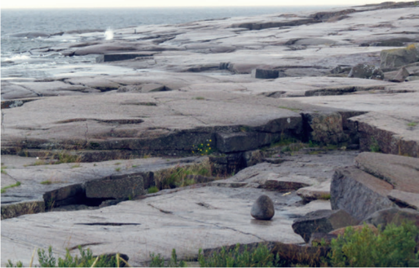
Diabashällar vid naturreservatet Rotsidan.

än vad vi ursprungligen hade tänkt. Vägen gick »rakt upp» till Slåttdalsbergets topp. Som stengetter klättrade vi i sicksack mellan stenblock, över stenblock och dragande oss upp i kvistar. Hjälpande händer drog och puttade vid behov. Klättringen var mödan värd. Framför oss bredde ett lappländskt landskap ut sig med mjukt rundade hållar, vattenfyllda hållkar, och igen en vidunderlig utsikt över Bottenviken. Bl.a. Ulvöarna låg för våra fötter. Vi befann oss då 250 m över havet.