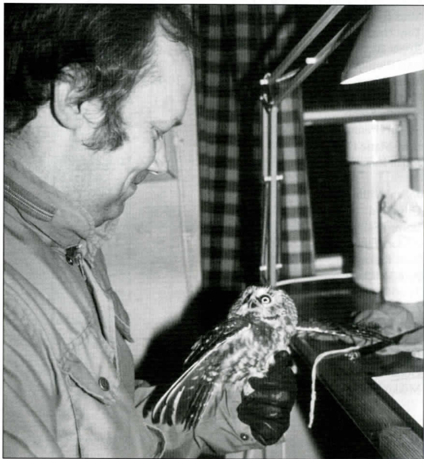
Hösten 1994 ringmärktes 74 pärlugglor på Valsörarna.