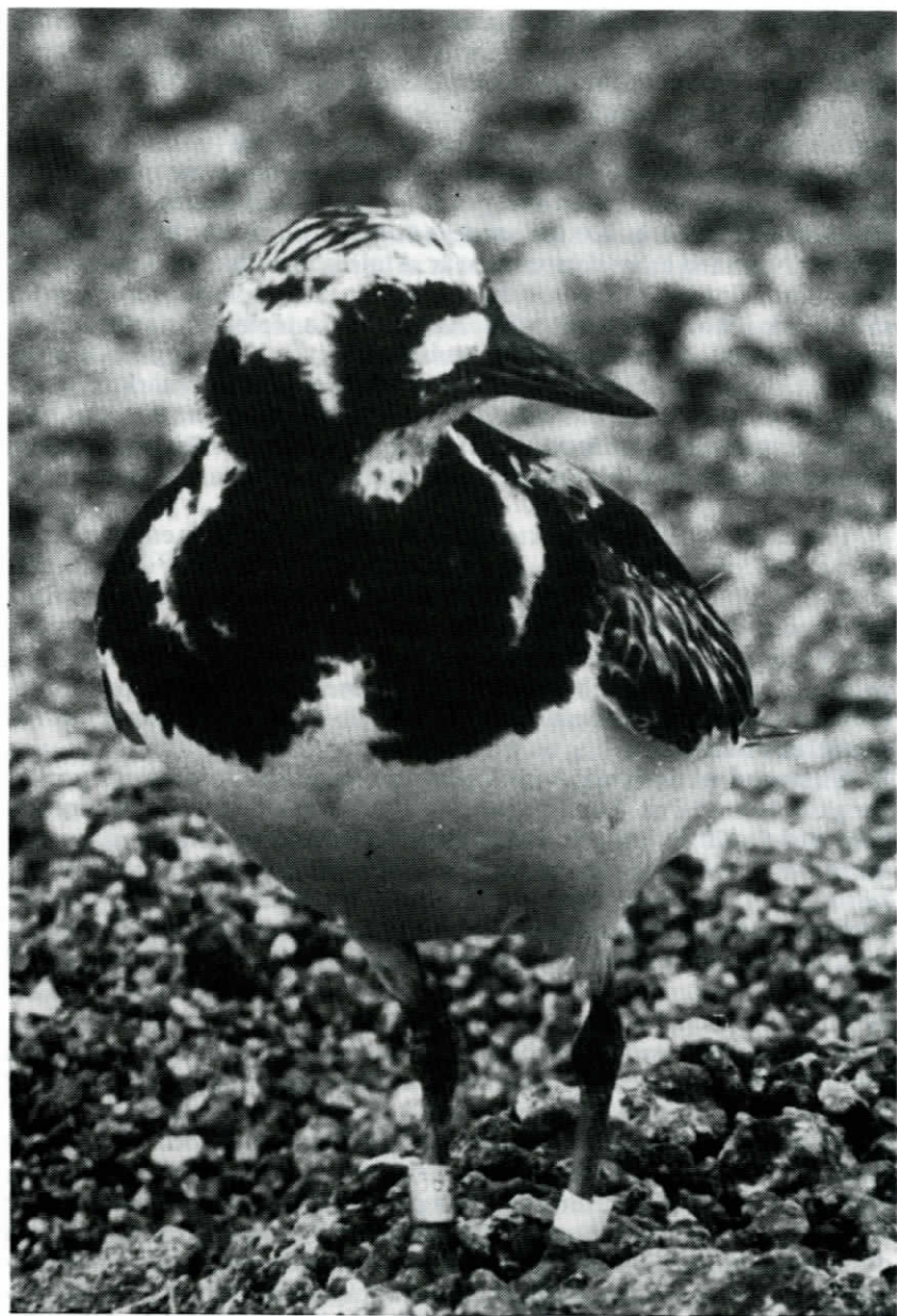
Holmöarnas vanligaste vadare — Roskarl, över 200 par häckar på öarna.