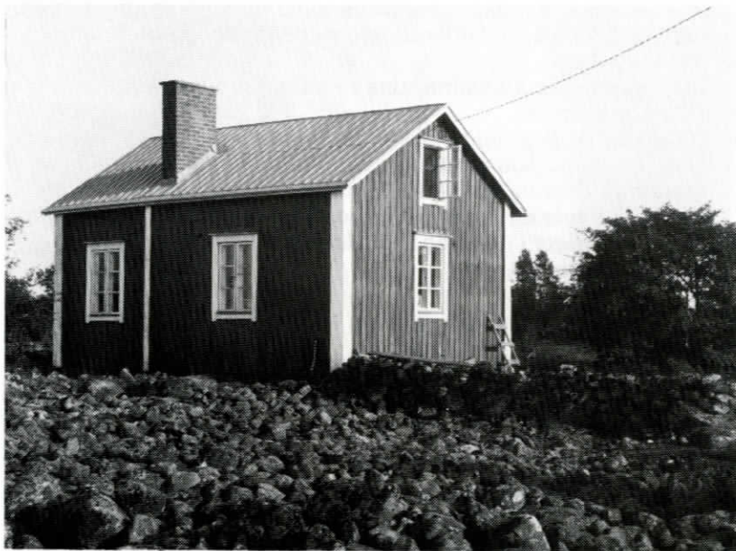
Valsörarnas biologiska station före ommålningen 1990.

Början var god, den 28 mars kunde den första besökaren göra observationer från ett så gott som snöfritt Valsörarna. Den tidiga våren medförde att havet svallade fritt. De första sjöfåglarna hade anlänt. I april var bemanningen dålig endast 6 dagar, 7—9 april och 24—26 april. I maj var det något bättre 12—14.5 och 19.5 samt 24—30 maj. Resultatet av vårens sträckfågelräkningar är därför bristfälligt, bl.a. fjällvråksträcket och lomsträcket blev helt ouppföljt.