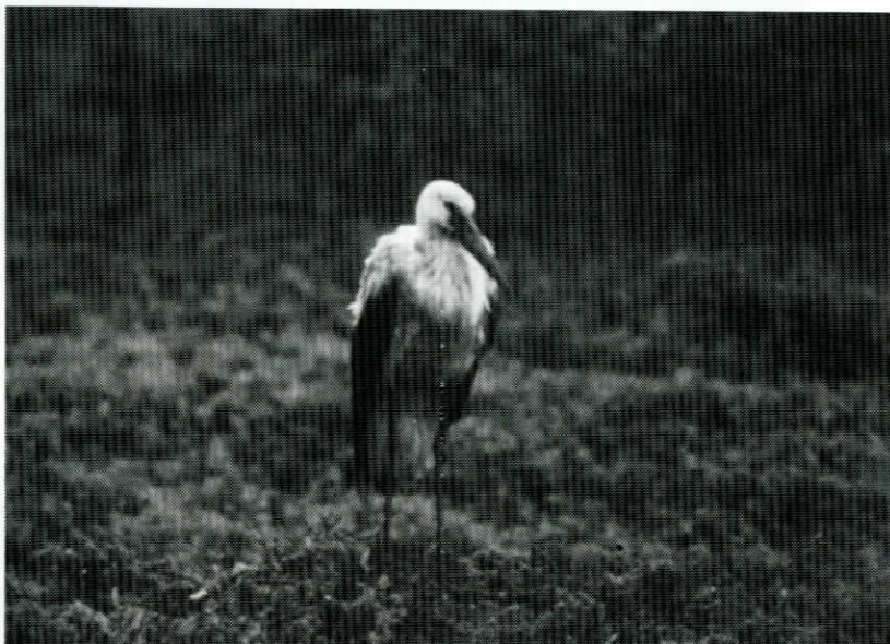
Vit stork på Valsörarna den märkliga dagen 15 oktober 1990.

En silltrut som märktes 5.7.1981 som bounce har hittats i Zaire den 28.10.1989, 7128 km S.